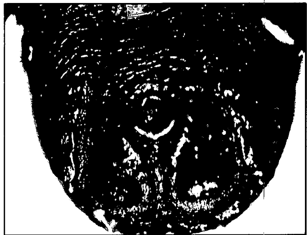
تصویر ۳- نمای سطح شکمی کنه هیالوما اژیپتیوم. حضور قطعات آداتال وساب آتال تحلیل رفته مشخص می باشد.