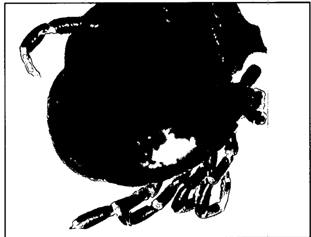
تصویر ۱- نمای سطح پشتی کنه هیالوما اژیپتیوم.