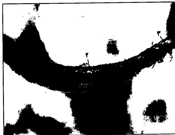
تصویر ۳- قالب جسم غاری آلت تناسلی. نمای شکمی- جانبی (رودوپاس). (۱) مجاری شکمی-جانبی داخل جسم غاری. (۲) مجرای پشتی. (۳) چند شاخه شدن مجاری در انتها.

ضرورت پیدا می کند. پس به طور کلی در هر بخش از طول آلت تناسلی که فضاهای غاری بیشتر و عریضتر هستند مجاری یا کانالهای خونی به آن بخشها کشیده خواهند شد.