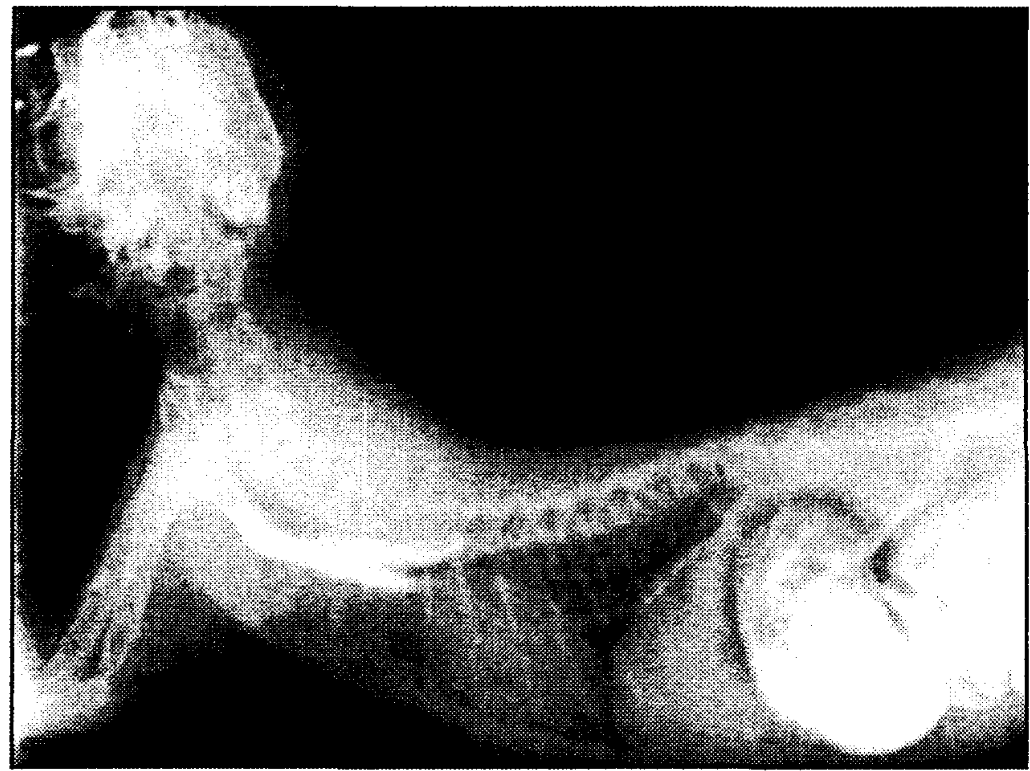
تصویر ۳ - رادیوگراف جانبی با سولفات باریم: کاهش علایم اتساع مری و بهبود انحراف شکمی نای، قلب و جناغ پس از ۲ ماه.