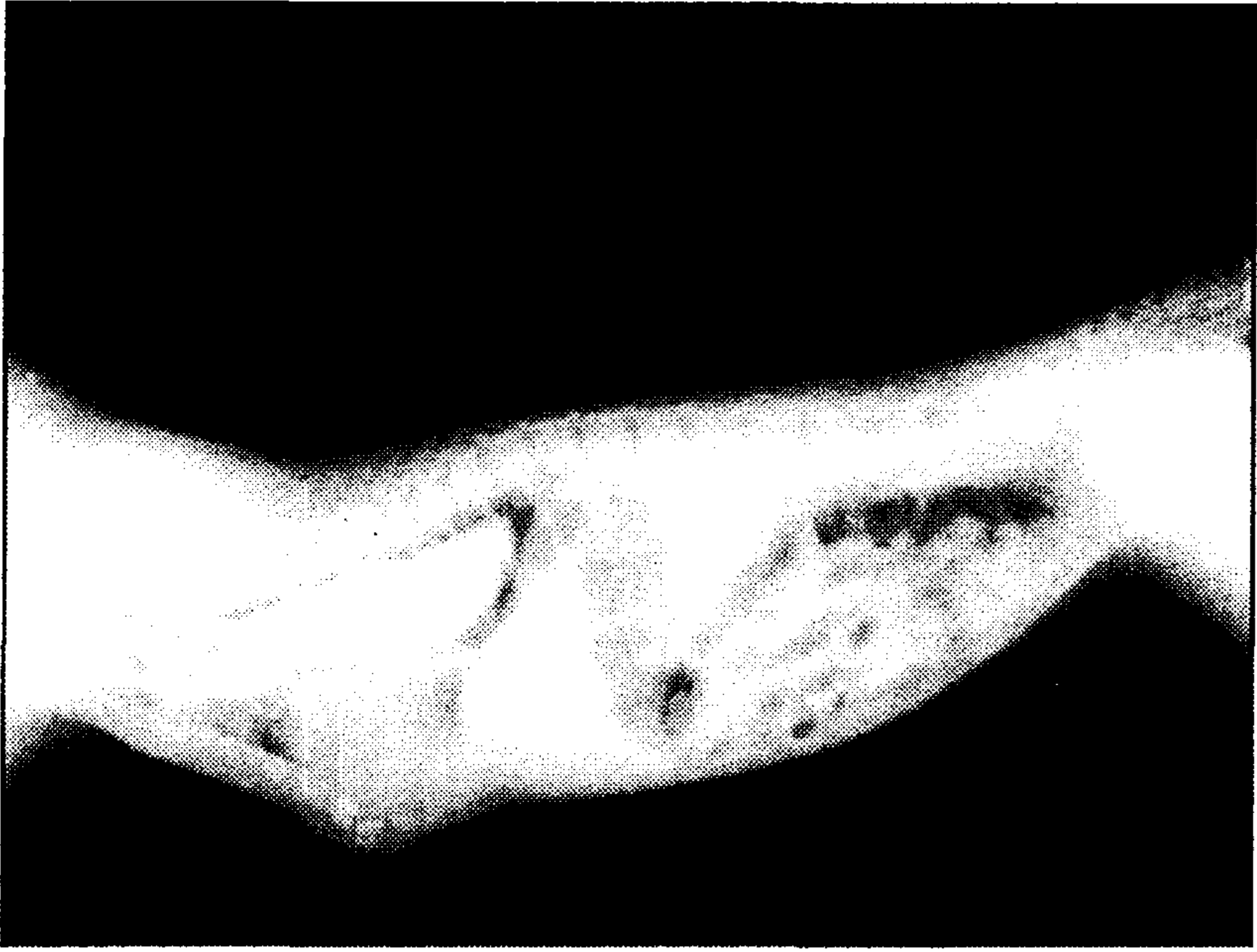
تصویر ۲ - رادیوگراف جانبی با سولفات باریم: محدوده اتساع مری توسط ماده حاجب مشخص گردیده است.