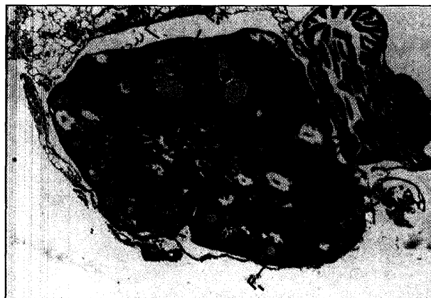
تصویر ۵ - تخمدان راست گروه روغن پنبه دانه هیدروژنه، زیر گروه سنی ۹ هفتگی. (F1 فولیکول نوع اول، F2 فولیکول نوع دوم و FM فولیکول بالغ، به جسم زرد در سمت چپ بالای تصویر توجه شود (H&E ۰۴۰)).