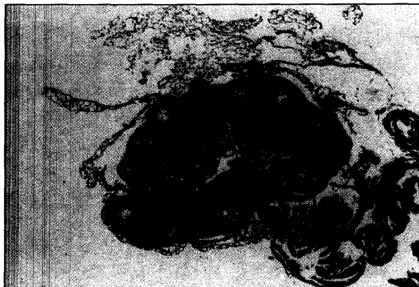
تصویر ۴ - تخمدان راست گروه روغن پنبه دانه هیدروژنه، زیر گروه سنی ۶ هفتگی (H&E ۰۴۰).