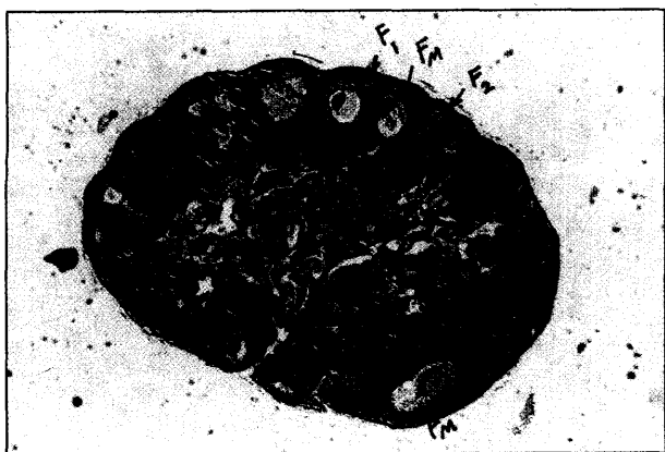
تصویر ۲ - تخمدان راست گروه شاهد، زیر گروه سنی ۹ هفتگی. (F1 فولیکول نوع اول، F2 فولیکول نوع دوم و FM فولیکول بالغ (H&E ×۴۰)).