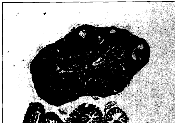
تصویر ۱ - تخمدان راست گروه شاهد، زیر گروه سنی ۶ هفتگی (H&E ×۴۰).