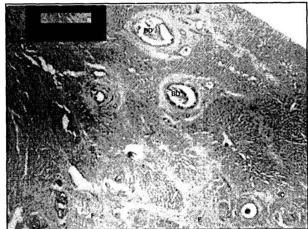
تصویر ۳- تکروز پارانشیم کبدی و فیبروز وسیع در پارانشیم کبدی (F)، نفوذ سلولهای آماسی تک هسته ای (I.C) (کولانژیوپاتی) اتساع مجرای صفراوی قابل مشاهده است (B.D).

گزارشهای مشابه در نشخوارکنندگان و شتر اشاره ای به وجود آن نشده است. این ضایعه با توجه به تشکیل فراوان بافت همبند، فیبروز گسترده و هیپر تانسین ناشی از آن قابل توجه است و عارضه ثانویه این ضایعات می باشد. با توجه به نقش کبد در تنظیم فعالیت های خونی، متابولیکی و ترشحی - دفعی وجود فاسیولا حتی به تعداد کم در صورتی که با ضایعات آسیب شناسی همراه باشد سلامت دام را مختل کرده و بر میزان تولید فرآورده هایش تأثیر می گذارد علاوه بر آن چون فاسیولا علاوه بر شتر از نشخوارکنندگان، تک سمیها، گراز و انسان هم در ایران گزارش شده است نقش شتر در اشاعه آلودگی در اکوسیستم های مختلف بویژه محل تردد شتر باید مورد توجه قرار گیرد و در هر برنامه کنترل و پیشگیری فاسیولیازیس نشخوارکنندگان، درمان شتر هم انجام گیرد.