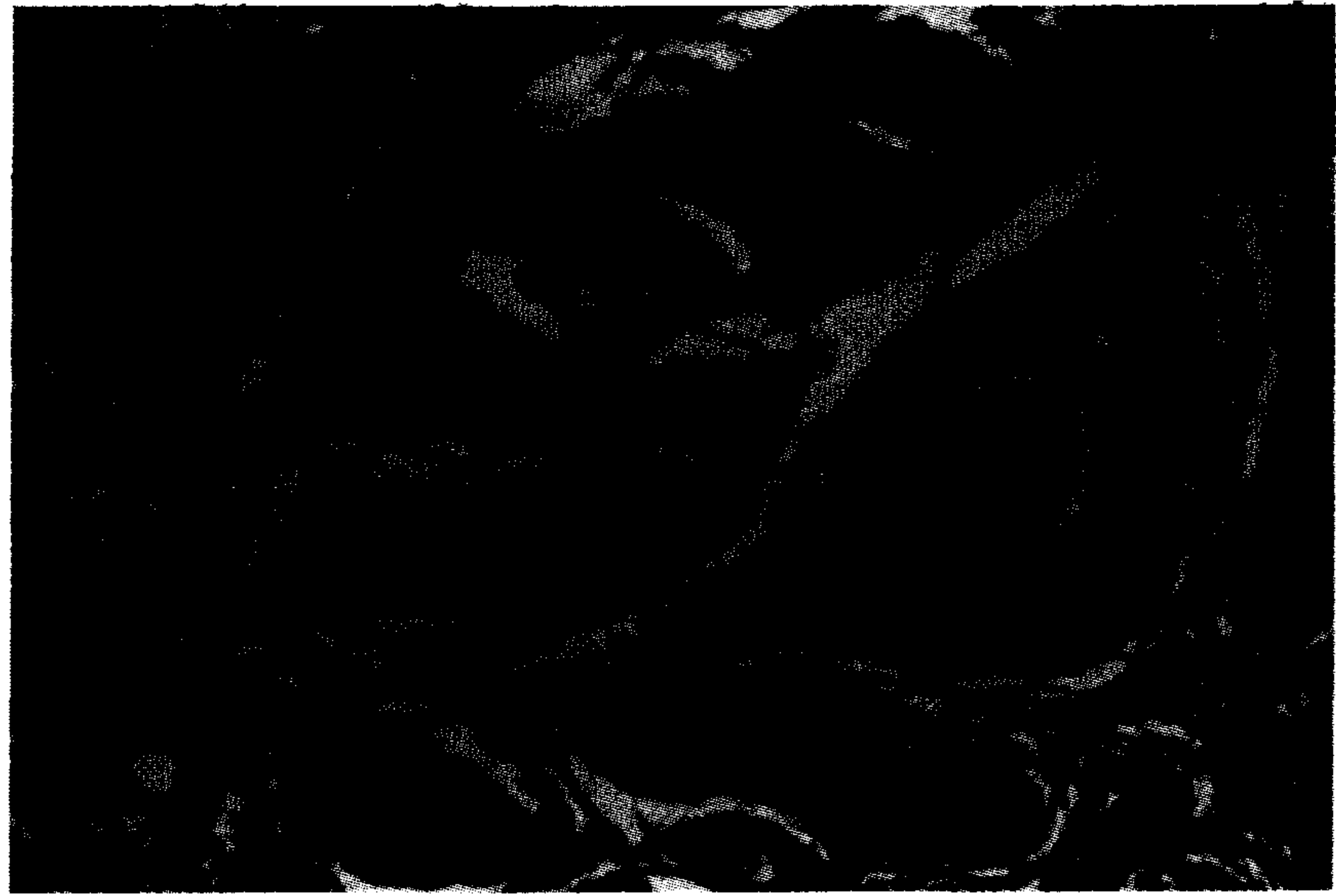
تصویر ۱ - فولیکولهای پوست بز کرکی رائینی (فولیکولهای اولیه و ثانویه) به همراه ضمام آنها در سه ماهگی (بزرگنمایی X۴۰۰).

۴ - نسبت فولیکولهای ثانویه به فولیکولهای اولیه: تفاوت میانگین حداقل مربعات نسبت فولیکولهای ثانویه به فولیکولهای اولیه در سنین مختلف معنی‌دار نیست (جدول ۱). این نسبت از تقسیم تراکم فولیکولهای ثانویه به فولیکولهای اولیه به دست می‌آید. از طرفی با افزایش سن تراکم فولیکولهای اولیه و ثانویه کاهش می‌یابد. به عبارت دیگر با افزایش سن صورت و مخرج کسر با هم کاهش می‌یابند. بنابراین نتیجه به دست آمده قابل انتظار است (۲۳، ۱۹، ۱۳). اثر وزن سه ماهگی بر تغییرات نسبت فولیکولهای ثانویه به فولیکولهای اولیه معنی‌دار است ( p < 0/05 ) (جدول ۵). به عبارت دیگر با افزایش وزن سه ماهگی این نسبت افزایش پیدا می‌کند. همانطور که قبلاً توضیح داده شد با افزایش وزن