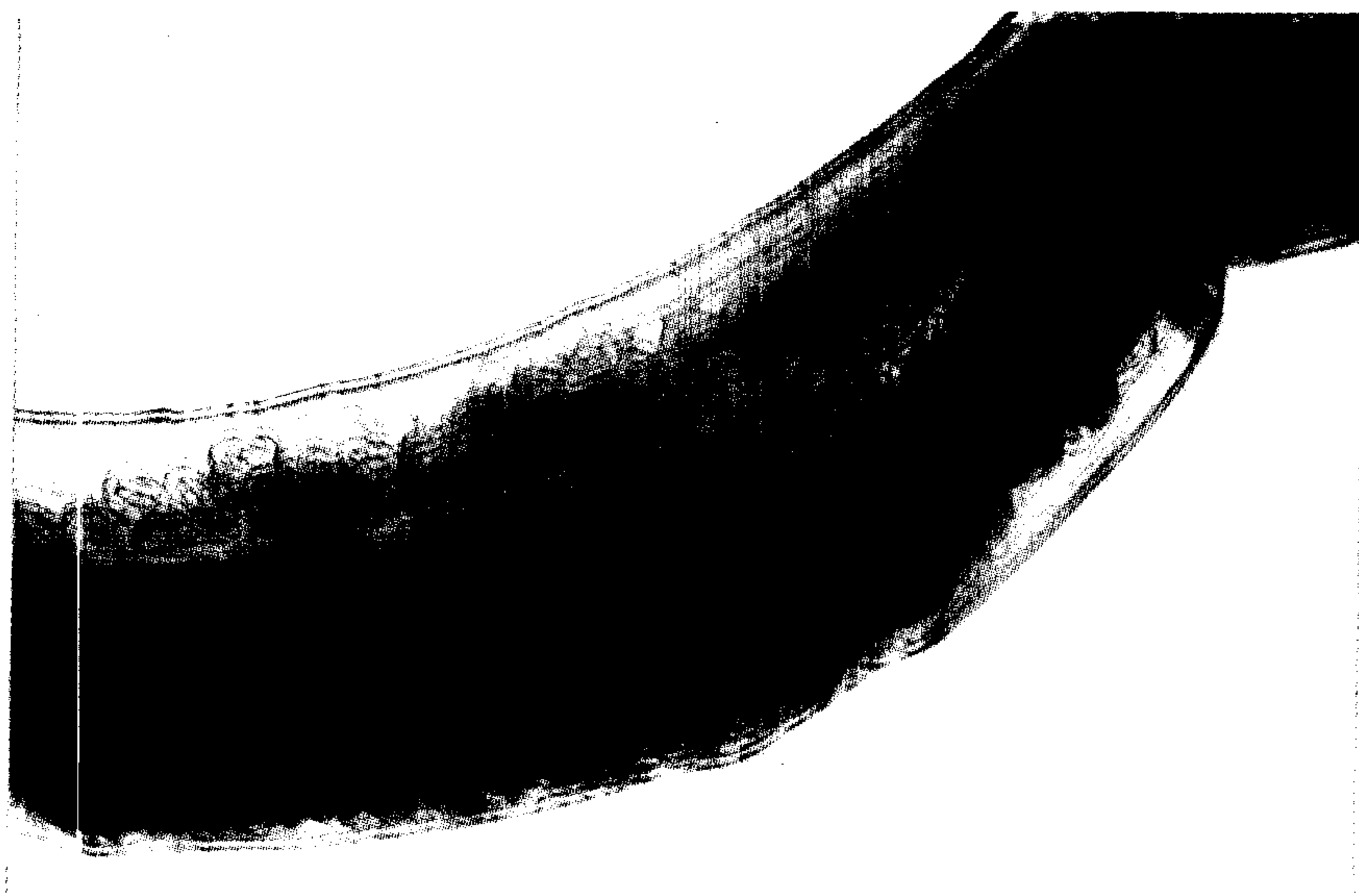
تصویر ۲ - رحم پر از تخم دیکتیوکولوس ویوپاروس ماده 10 \times .

در ایران هر ساله مقادیر زیادی از تولیدات و فرآورده های دامی بنا به دلایل مختلف نابود می گردد و در این میان نقش بیماریهای انگلی در بروز این خسارات بسیار چشمگیر است. در این ارتباط انگلهای دستگاه تنفس ضررهای اقتصادی فراوانی را به پرورش دهندگان دام وارد می نمایند. دیکتیوکولوس ویوپاروس انگل دستگاه تنفس گاو و گاومیش در نقاط مختلف دنیا ایجاد خسارت و تلفات می نماید (۱). آلودگی با این انگل در گوساله هایی که در سیستم بسته پرورش داده می شوند نسبت به پرورش سیستم باز بیشتر است. این آلودگی در گوساله های سیستم بسته ۸/۸۲ - ۸/۷۵ درصد و در سیستم باز ۱۵ - ۱۰ درصد گزارش شده است (۳). گزارش منتشر شده ای از حضور و احتمالاً عوارض این کرم در ایران وجود ندارد و تنها یک کرم نر از ریه یک راس گاو از ناحیه گرگان جدا شده است (۱). پژوهش حاضر جهت تعیین و شناسایی آلودگی به دیکتیوکولوس ویوپاروس در گاو و گاومیش انجام شده است.