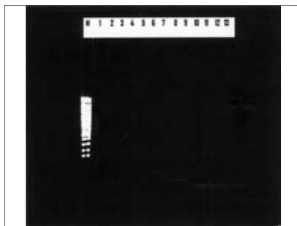
تصویر ۵- آزمایش PCR برای تشخیص گونه مایکوئیدس مایکوئیدس کلونی بزرگ در نمونه‌ها و تکثیر قطعه ۱۹۵ bp در نمونه‌های مثبت. ستون M: مارکر DNA (MW marker ladder 100). ستون ۱۲-۱: تشخیص کلاستر مایکوئیدس در نمونه‌های بافتی. ستون ۱۳: آزمایش نمونه ریه با گونه آگالاکتیه (کنترل منفی).

و ۴۲۰ می‌کنند. که محل اثر آنزیم در جایگاه نوکلئوتیدهای ۸۴۵ تا ۸۵۰ از rRNA 16S قرار دارد. اپرون rrnB در گونه M.ccp، بدلیل موتاسیون نقطه‌ای (A/G) فاقد جایگاه اثر آنزیم است، به همین دلیل سه باند ۵۴۸، ۴۲۰ و ۱۲۸ تشکیل می‌شود که جایگاه آن در محل دومین ژن نوکلئوتیدهای ۱۰۶۴ و ۱۱۵۵ است (۳). Pettersson (۱۹۹۸) در تحقیقی دیگر نشان داد که این آنزیم در گونه M.ccp، سه باند ۷۸۵، ۷۰۳ و ۸۲ با مکانیسم مشابه ایجاد می‌کند (۱۶). امدار این دوروش، به دلیل وجود rRNA هضم نشده (متعاقب اتصالات ناهمگون) از نظر تنوری، احتمال ایجاد الگوی مشابه M.ccp توسط گونه‌های دیگر در الکتروفوروز وجود دارد (۲۲). این امر موجب نتایج مثبت کاذب می‌شود. به همین علت، در این مطالعه به منظور کاهش نتایج کاذب، از گونه آگالاکتیه که در خارج از این کلاستر قرار دارد، به عنوان کنترل منفی استفاده شد.