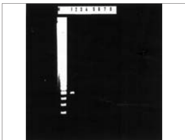
تصویر ۴- آزمایش PCR برای تشخیص گونه آگالاکتیه در نمونه‌ها و تکثیر قطعه ۳۷۵ bp در نمونه‌های مثبت. ستون M: مارکر DNA (MW marker ladder 100). ستون ۱: نمونه کنترل مثبت (نمونه واکسن آگالاکتیه). ستون ۷-۲: تشخیص گونه آگالاکتیه در نمونه‌های بافتی. ستون ۸: آزمایش نمونه ریه با گونه آگالاکتیه (کنترل منفی).