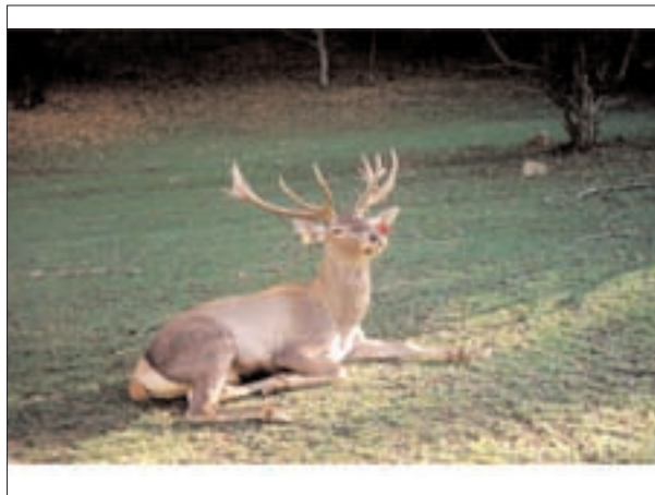
تصویر ۱- عکسی از یک گوزن قرمز نر بالغ زیر گونه مارال در آینالو، منطقه حفاظت شده ارسباران (آذربایجان شرقی).