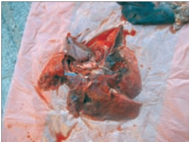
تصویر ۲- ریه گوساله مارال مبتلا به آندوتوکسمی ناشی از عفونت توام اشرشیاکلی و کلبسیلا پنومونیه، پرخونی شدید و ادم ناشی از شوک ریوی جلب توجه می‌کند.