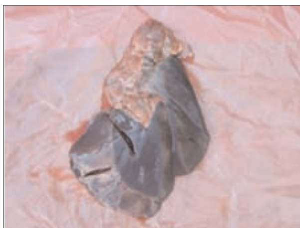
تصویر ۳- کبد گوساله مارال مبتلا به آندوتوکسمی ناشی از عفونت توام اشرشیاکلی و کلبسیلا پنومونیه، پر خونی شدید بافت کبد مشهود است.