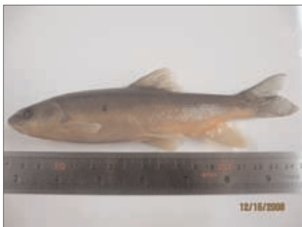
تصویر ۱- سیاه ماهی Capoeta damascina صید شده از هلیل رود.

بر اساس نتایج این تحقیق مجموعاً ۷ انگل از جنس میکسوبولوس ( Myxobolus ) شناسایی گردیدند. اسامی انگلها عبارتند از: میکسوبولوس سامگوری بکوس، میکسوبولوس واریکورینی، میکسوبولوس کریستاتوس، میکسوبولوس موسایوی، میکسوبولوس بوکی، میکسوبولوس کارلیکوس و میکسوبولوس سوتورالیس. آلودگی انگلی در کلیه فصول سال در ماهیان دیده شد و فراوانی آلودگی در فصول مختلف، متفاوت است. از مجموع ۱۰۹ ماهی بررسی شده، ۷۳ درصد آن ها آلوده به انگل های مختلف بودند. جدول ۱ تعداد ماهیان بررسی شده در فصول و ایستگاه های مختلف و درصد آلودگی را بیان نموده است. فراوانی آلودگی در ایستگاه های مختلف نیز متفاوت بوده است. مشخصات انگل های میکسوبولوس جدا شده از سیاه ماهی C. damascina در این تحقیق در جدول ۲ بطور خلاصه بیان شده است.