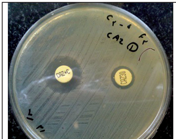
تصویر ۱. تست تایید فنوتیپی ESBL جدایه‌های اشریشیاکلی مدفوعی طیور با استفاده از دیسک‌های سفنازیدیم (CAZ۲۰) و سفنازیدیم-کلاولانیک (CAZ+C).