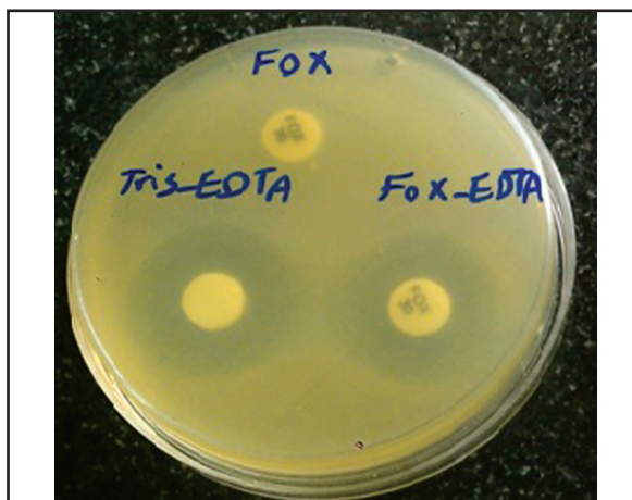
تصویر ۲. تست تشخیص فنوتیپی جدایه‌های تولیدکننده بتالاکتاماز AmpC با استفاده از دیسک‌های سفوکسیتین (دیسک بالا) و سفوکسیتین-EDTA (دیسک پایین).