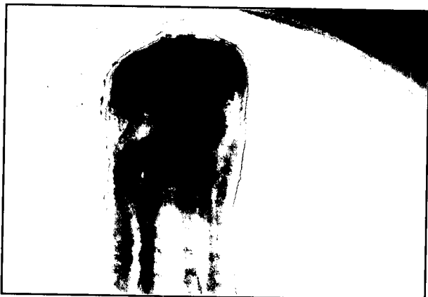
تصویر ۲- انگل اوسترونزیلیدس اکسیسوس (ناحیه دم) بزرگنمایی ۱۰۰.