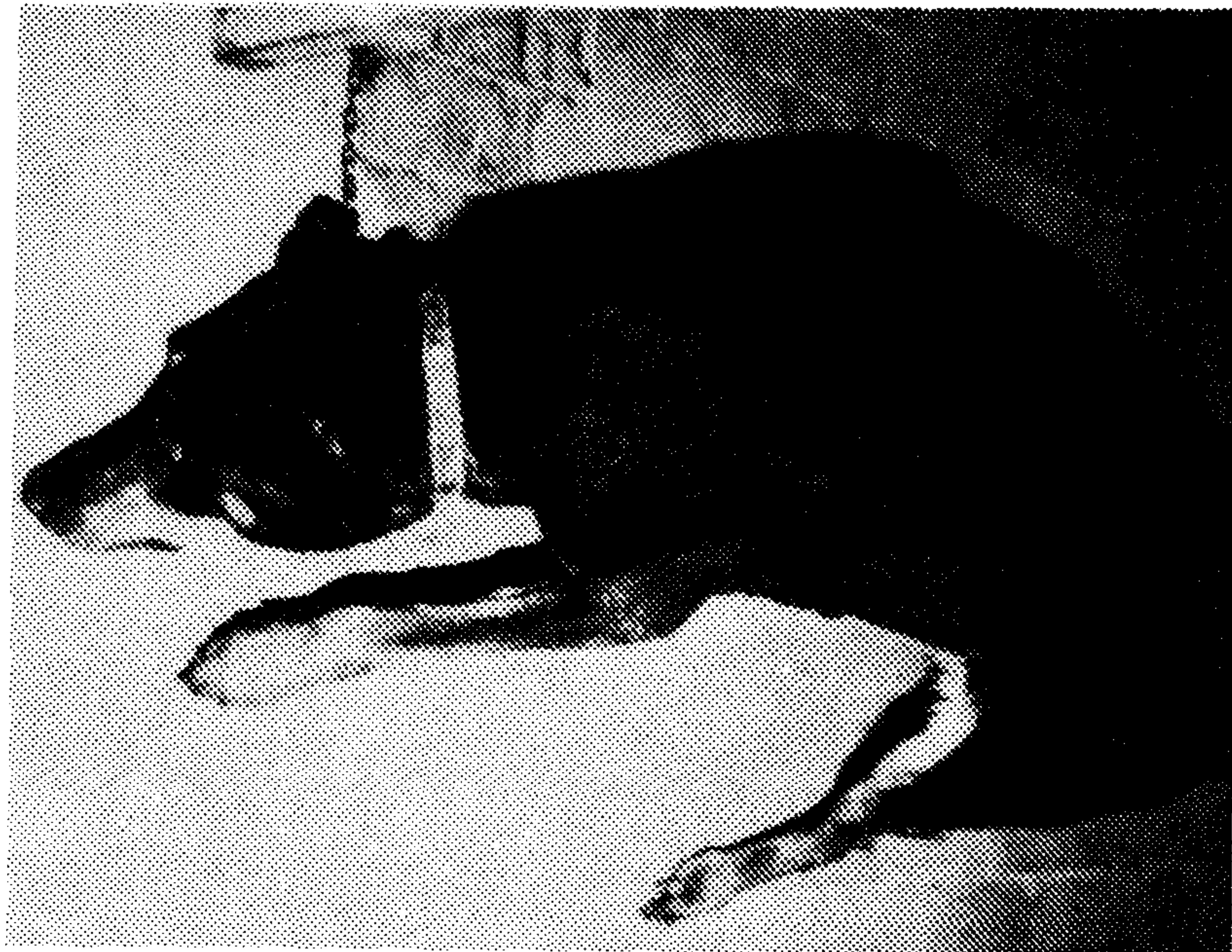
تصویر ۲ - عدم تعادل و افتادن روی زمین در سگ مبتلا به بیماری دستگاه دهلیزی در سگهای پیر

۵. پولیپهای آماسی (Inflammatory polyps): این پولیپها نیز که