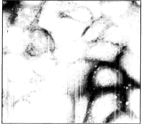
تصویر ۱ - الف) فلئورسنت سبز درخشان در نمونه‌های مثبت در مقایسه با ب) فلئورسنت زمینه‌ای در موارد منفی.

لوله‌ها در ۸۰۰۰۰g (۲۶۰۰۰ دور در دقیقه) در درجه حرارت ۴ درجه به مدت ۲ ساعت اولترا سانتریفوز گردید. مایع رویی دور ریخته شده و رسوب باقی‌مانده را پس از حل کردن در \frac{1}{10} حجم اولیه در بافر به‌عنوان پادگن جهت انجام آزمایش مورد استفاده قرار می‌گیرد.