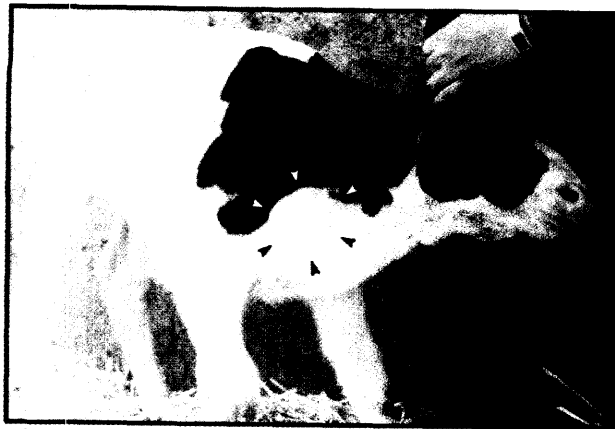
تصویر ۱- گوساله مبتلا به قلب اکتویک. پیکان‌ها محل قرار گرفتن قلب در زیر پوست ناحیه گردن را نشان می‌دهد.

قلب در ناحیه گردنی به سمت بالا و چپ قرار گرفته و کاملاً مدور شده بود. نوک قلب (Apex) به سمت چپ و بالا و قاعده آن (Base) به سمت خلف و پایین قرار گرفته بود. جهت قلب ۱۸۰ درجه در جهت خلاف عقربه‌های ساعت حول محور طولی خود چرخیده و تا ناحیه نزدیک به فک پایین کشیده شده بود. رباط پریکارد در سمت چپ به طرف گردن و تا ناحیه فک پائین در داخل و خارج عضلات به صورت منتشر ادامه پیدا کرده بود. در تشریح قسمت خارجی قلب و رگها یافته‌ها از این قرار بود: سرخرگ تحت ترقوه‌ای چپ (Left Subclavian Artery) از قوس آئورت در فاصله کمی نرسیده به مجرای سرخرگی (Ductus Arteriosus) جدا می‌شد. از سرخرگ تحت ترقوه‌ای راست (Right Subclavian Artery) سرخرگهای کاروتید (Carotid) و فکی (Axillary) منشعب می‌شد و سرخرگ ششی نسبتاً بزرگ و بین این سرخرگ و آئورت، PDA (Patent ductus Arteriosus) وجود داشت. بعد از باز کردن قلب هیچ‌گونه نقیصه بین بطنی (VSD) در قلب مشاهده نشد و دریچه‌های قلب نیز کامل و بدون نقص بودند. شکاف به داخل دهلیز ادامه یافت و در آنجا نیز مدخل ورید اجوف فوقانی و پشتی مشاهده گردید. سوراخ بیضی باز بود و لختی از آن خارج گردید.