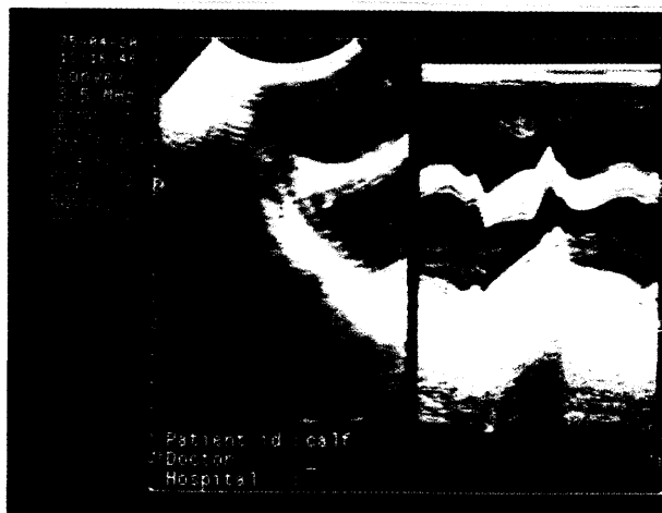
تصویر ۲- Short Axis Scan. هیپرتروفی اکستریک بطن راست. حرکات سپتوم پارادوکسال بوده که مشخص‌کننده افزایش بار حجمی می‌باشد. هیپرتروفی اکستریک بطن چپ باضافه بار حجمی بطن چپ و فرورفتگی دیوار خلفی بطن چپ قبل از شروع سیستول.