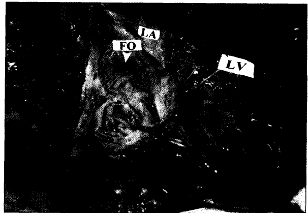
تصویر ۶- بطن و دهلیز چپ پس از باز شدن. به هیپرتروفی دیواره بطن چپ و باز بودن سوراخ بیضی (نوک پیکان) توجه شود.

F.D= Foramen ovale LA= Left Atrium LV= Left ventricle