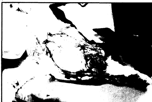
تصویر ۴- قلب و پوشش پریکارد در ناحیه گردن پس از کالبدگشایی.

ناهنجاریهای دهلیزها، بطن‌ها، دریچه‌های قلب، عروق بزرگ، دنده‌ها و کانال توراسیک تاکنون همراه با قلب نابجا مشاهده و گزارش شده است. هیپرتروفی بطن‌ها و بازماندن سوراخ بیضی و PDA نیز در گزارشها آمده است. از جمله Bowen و Adrian در یک رأس گوساله مبتلا به قلب اکتوبیک