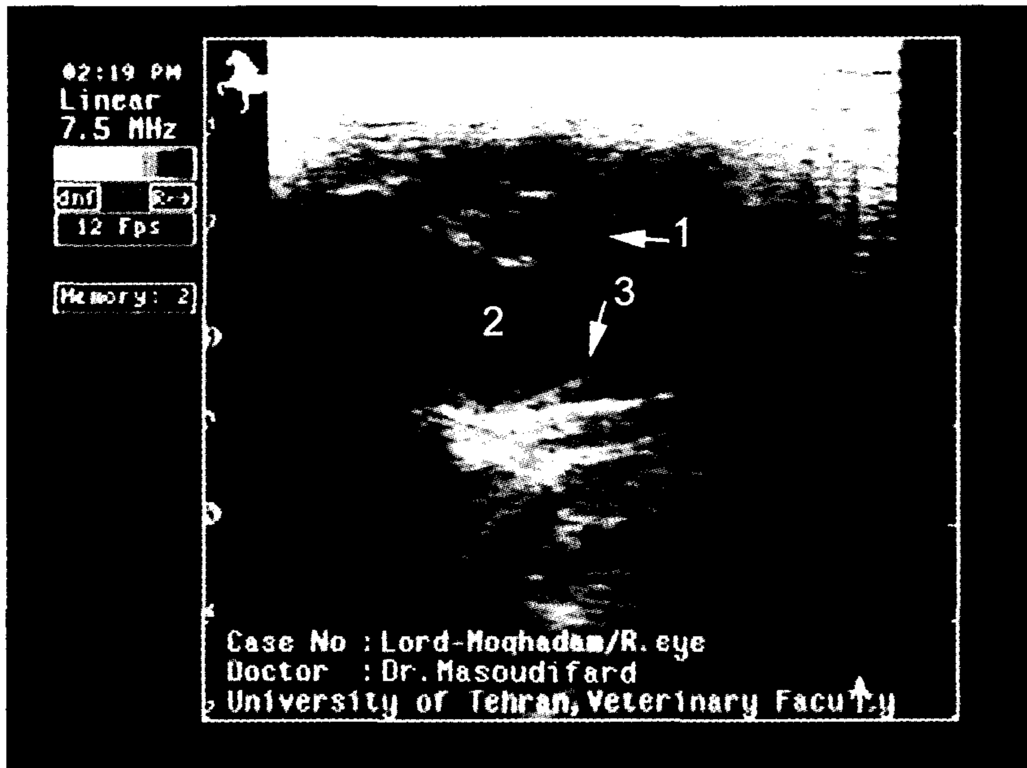
تصویر ۲- نمای اولتراسونوگرافی جداشدگی بخشی از شبکیه، ۱: لنز مبتلا به کاتاراکت؛ ۲: زجاجیه؛ ۳: شبکیه جدا شده.

حیوانات بخوبی شناخته نشده ولی احتمالاً یکی از عوامل مستعد کننده جداشدگی شبکیه می باشد (۷).