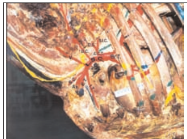
تصویر ۳- نمای سمت چپ، تنه بازویی سری و انشعابات سرخرگ زیرترقوه‌ای چپ (نمونه فیکس شده ۳). نامگذاری مطابق با شرح تصویر ۱ می‌باشد.

محل جدا شدن سرخرگ مهره‌ای سمت راست در تمام نمونه‌های فیکس شده در محدوده‌ای از مقابل دنده ۱ تا فضای بین دنده‌ای ۱ و در طرف چپ از مقابل دنده ۱ تا مقابل دنده ۲ مشخص گردید (تصویر ۲). در نمونه تازه ۲ در سمت راست و چپ به ترتیب در مقابل دنده ۲ و در فضای بین دنده‌ای ۲ (ولبه خلفی دنده ۲) تعیین شد.