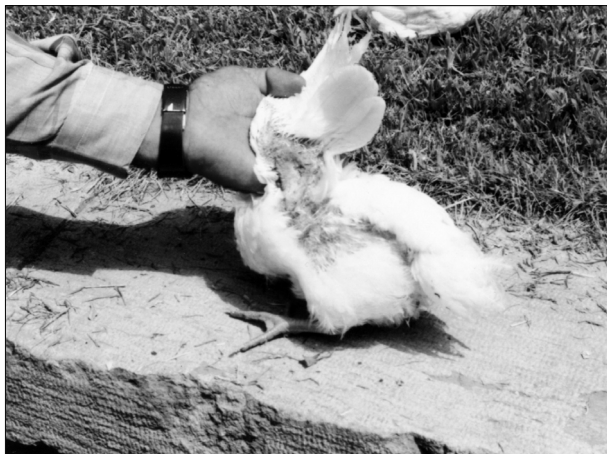
تصویر ۵- آسپرژیلوزیس جلدی در طیور، در قسمت زیر بال‌ها کلونیزاسیون آسپرژیلوس فومیگاتوس مشاهده می‌گردد.