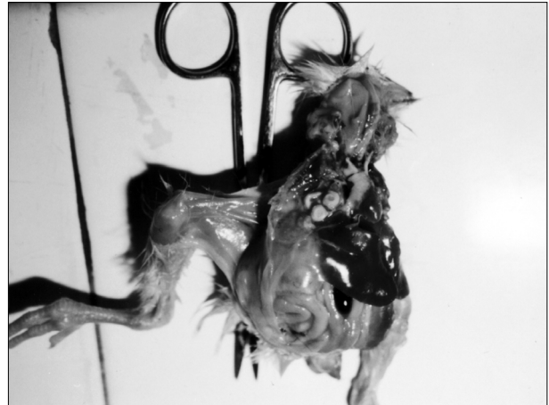
تصویر ۱- ریه مبتلا به آسپرژیلوزیس، ندول های درشت سطحی به خوبی نمایان می باشد.

درصد) بوده است. در قناری علاوه بر آسپرژیلوزیس ریوی، ۳ مورد آسپرژیلوزیس چشمی نیز دیده شد و در کبوتر نیز آسپرژیلوز چشمی (۱ مورد) و پوستی (۱ مورد) نیز دیده شده است. در حالی که در سایر پرندگان تنها آسپرژیلوزیس ریوی مشاهده گردید (تصاویر ۵-۱).