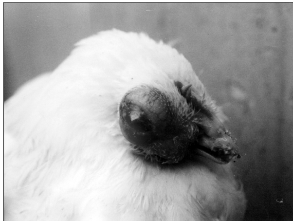
تصویر ۴- آسپرژیلوزیس چشمی در ماکیان، توده زرد رنگ داخل بافتی به خوبی نمایان می‌باشد.