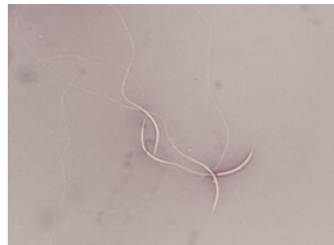
تصویر ۱. زنده‌مانی (1000x).