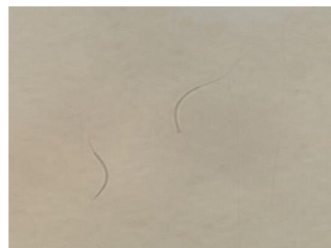
تصویر ۳. سلامت آکروزوم (1000x).