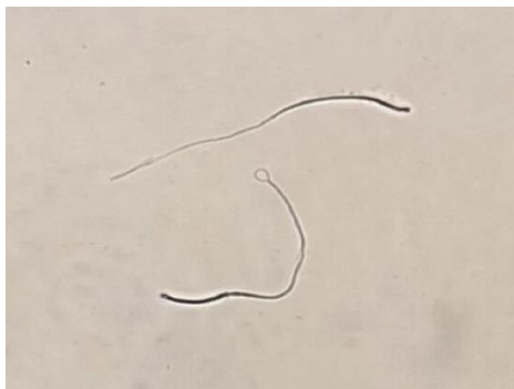
تصویر ۲. سلامت غشاء (1000x).

سلامت آکروزوم: مقایسه میانگین‌های فراسنجه سلامت آکروزوم در جدول ۳ آمده است. افزودن ۰/۵۶ CMP موجب بهبود سلامت آکروزوم بعد از ۷۲ ساعت نگهداری در دمای ۴ درجه سانتی‌گراد نسبت به تیمار شاهد شد ( P < 0/05 ).